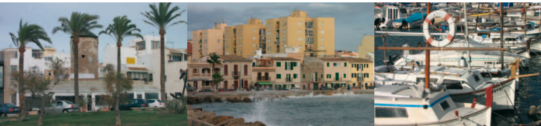
Heute: Urbane Ausflugsmeile mit schicken Cafés und Restaurants zwischen renovierten Häusern. Today: Urban strolling boulevard with chic cafés and restaurants between renovated houses. Hoy: Milla Urbana de excursión con elegantes cafés y restaurantes entre casas renovadas.

ab. Urlauber, Zugezogene und Einheimische genießen auf den Terrassen der zahlreichen Lokale Café und Kuchen oder Tapas und frischen Fisch. Denn gastronomisch zählen die neuen Szeneviertel zu den ersten Adressen in der Stadt, und besonders an den Wochenenden geht es ausgesprochen lebendig zu.