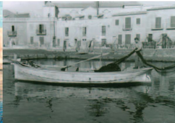
Gestern: Die Orte Portixol und Es Molinar waren geprägt vom Treiben der Fischer. Yesterday: Portixol and Es Molinar were characterised by the hustle and bustle of the fishermen. Ayer: Los lugares Portixol y Es Molinar se caracterizaron del movimiento por los pescadores.

klein wirkenden Häuser haben Innenhöfe, in denen Bougainvilleas und Palmen wachsen, sowie Dachterrassen mit Meerblick.